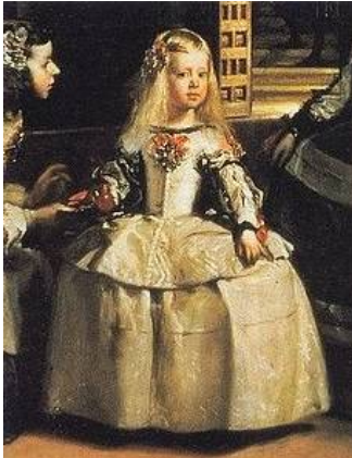
fig.1 - Detalhe da obra de Diego Velázquez

1.2. Estude cuidadosamente as relações geométricas e proporcionais entre as diferentes partes constituintes da composição e, tendo por base o processo expressivo, represente-a de dois pontos de vista, dando especial atenção ao seu enquadramento na folha de papel e procurando tirar partido dos valores lumínicos. Deverá ter em especial atenção, a escala, a volumetria, a textura, a cor e o material. Os materiais utilizados deverão ser, preferencialmente, o lápis de cor, pastel ou cera, marcadores, caneta de ponta fina ou média. (3 valores)